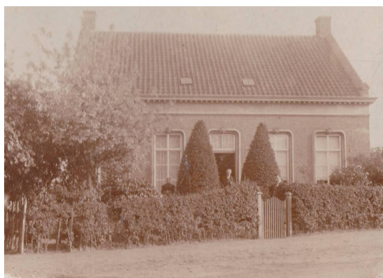
Na de dood van opa Anton ging oma Fransje van der Beek in de latere kleuterschool in Sprang wonen.